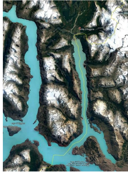
Área de Postulación Aysén Sur