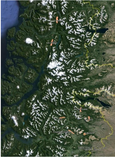
Área de Postulación Aysén Norte

Las localidades a ser beneficiadas con la oferta de Servicio Público corresponden a las que se indican en la siguiente tabla y que se presentan en las siguientes imágenes.