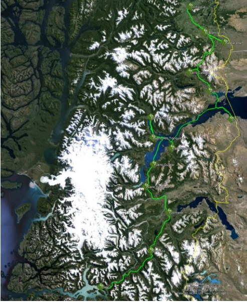
Tabla 2: Ubicación de los POIT Terrestres de la Troncal Terrestre Aysén.